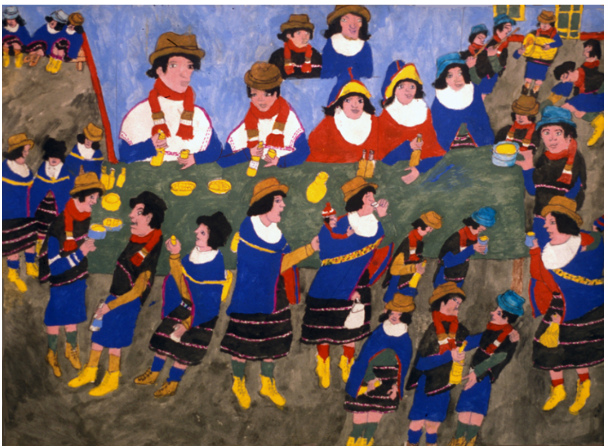
Sentados a la mesa los novios y novias, con sus trajes de fiesta, son el centro