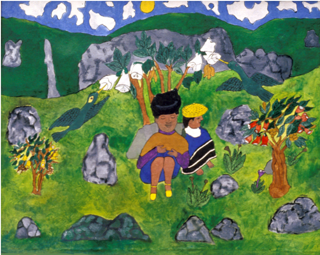
El colibrí, la sombra del yash . Aparecen sus tres variedades