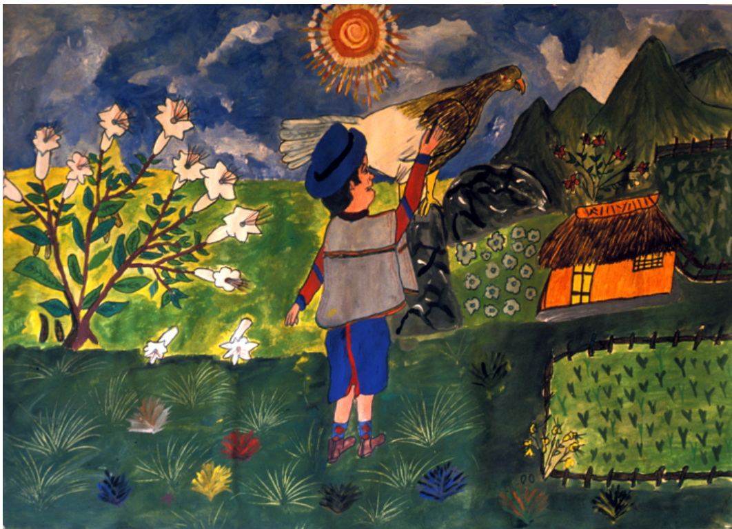
El yash (blanco) le da sueño de pintar; al fondo, yash rojo