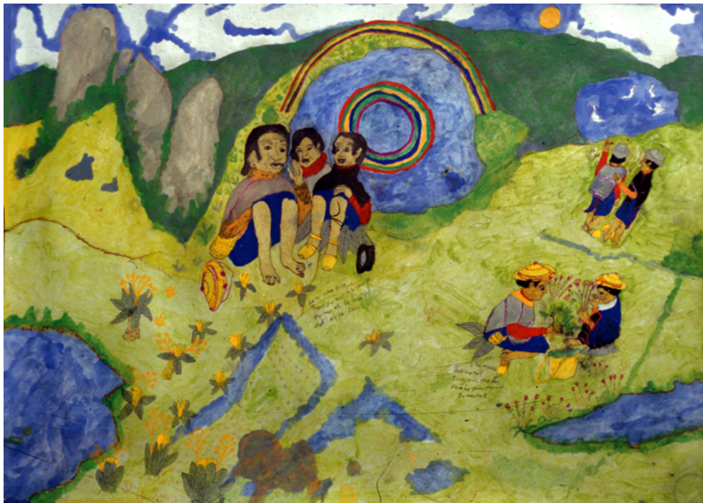
Aprendiendo de plantas en la sabana del páramo