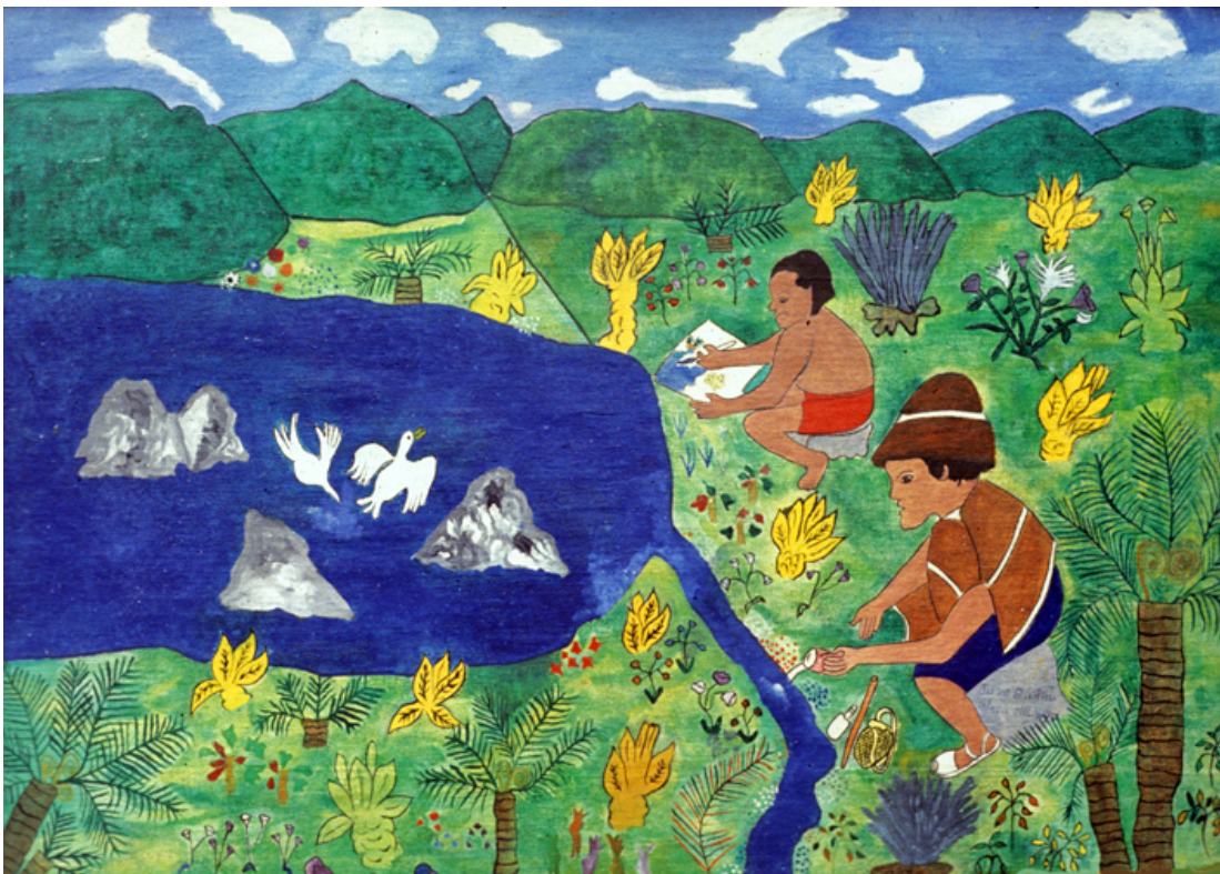
Pisihimisak , en figura de hombre, enseña de pintar