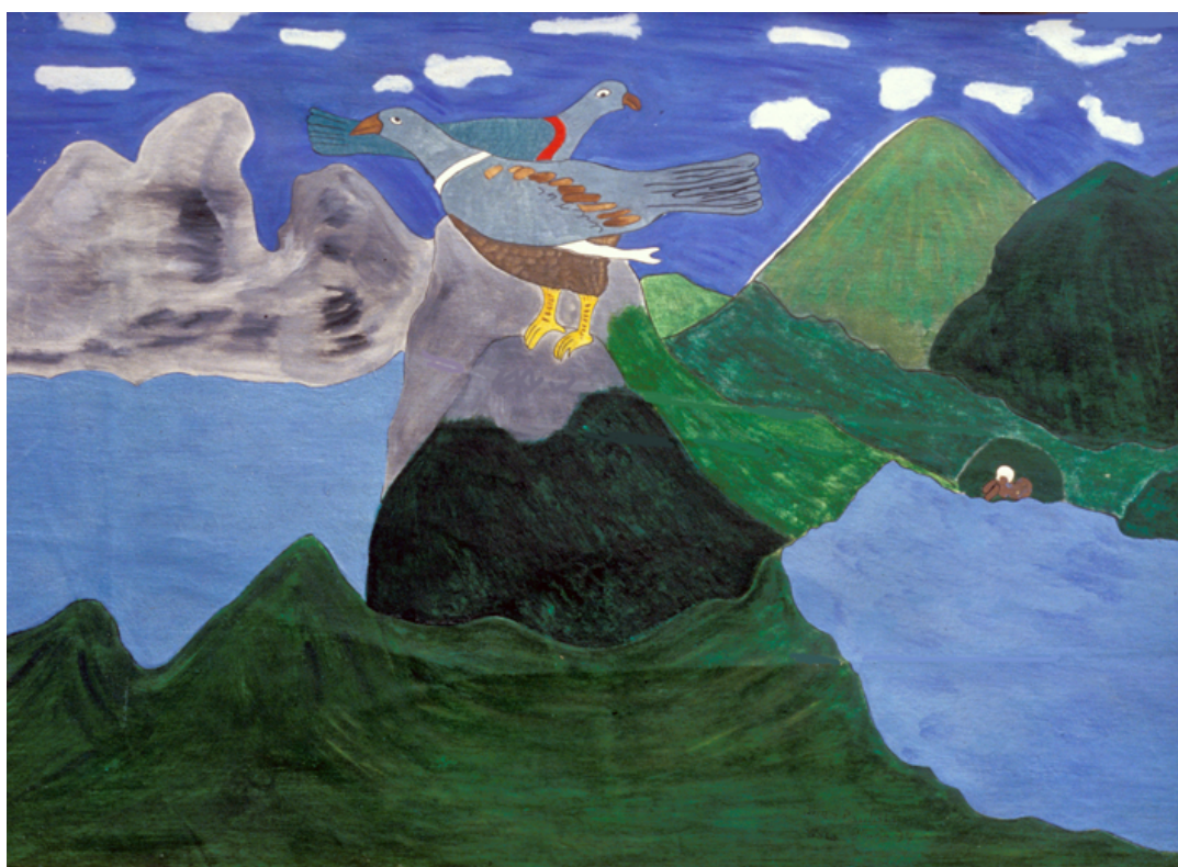
Peñas y lagunas en la Kunduría