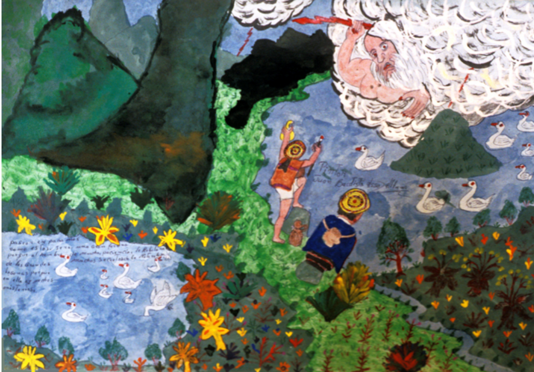
Trabajo con Srekøllimisak , aguacero, en la laguna

azotando a aguacero. (Para visión más extensa y profunda sobre este tema, ver Srekøllimisak. Historia del señor aguacero , http://www.luguiva.net/cartillas/subIndice.aspx?id=1 ).