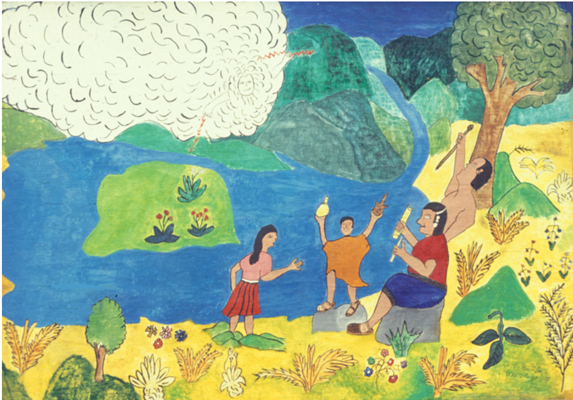
Trabajo con los rayos de aguacero

Kesrempete es el aroiris, es la misma agua, pero tiene unos colores: amarillo, rojo, verde y morado. Va desde una ciénaga hasta una laguna; a través de él, el agua pasa de la laguna a la ciénaga y de allí va regando un mal. También puede estar entre dos lagunas o dos ciénagas. Une entre sí los pikap (ojos de agua) o los barriales. No se queda quieto en un solo lugar; es vivo y camina y, al caminar, va redondeando. Por eso se dice que es pete , una rueda cerrada. Cuando va a venir aguacero, Kesrempete está hacia abajo y se redondea como lo hacen los caminos del sol y de la luna.