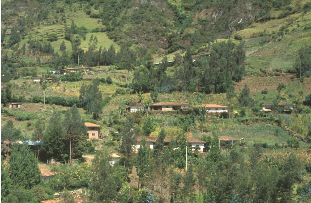
Casas más altas de vereda Peña del Corazón