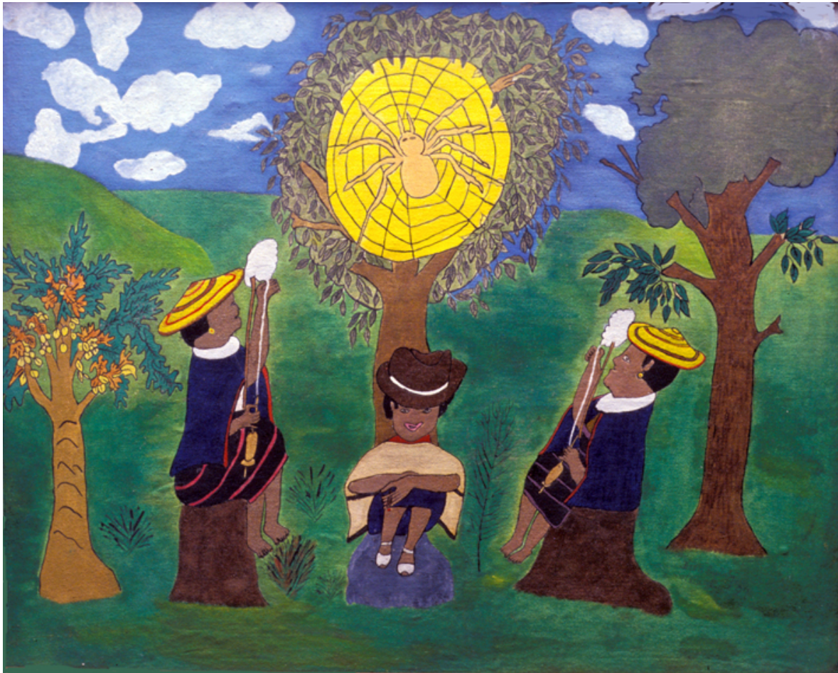
Aprendiendo el tejido de la araña