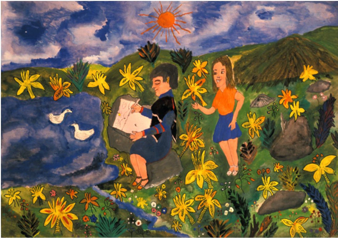
Pishimisak , en figura de mujer, da indicaciones de pintar