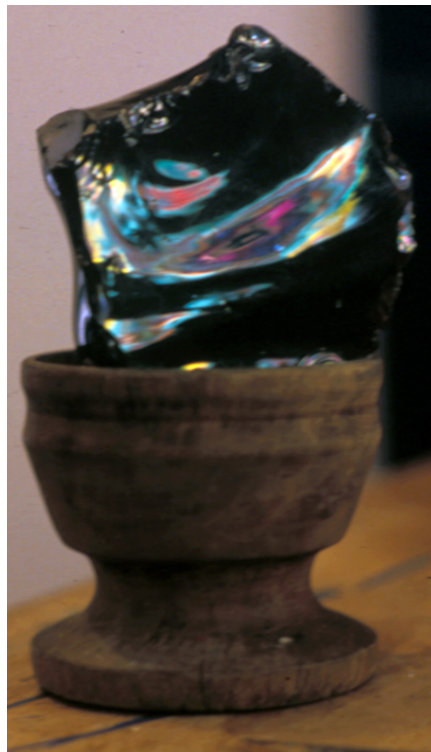
Piedra del rayo

Para traer a aguacero, los mørepik tienen que ser dos y haber recibido sueños de hacer llover: el mayor, que sabe de ese trabajo, y el menor ( purepalpik ), que recoge el sentido de cómo recoger el trabajo y el remedio. Este avisa y el mayor trabaja: pone el tachi en medio de una corona hecha con un bejuco que se llama chiyasr , para envolver con la sombra del viento; se coloca en los cuatro sitios de la laguna y a la izquierda de esta se deja una jigrada de coca. A un lado se pone la piedra del rayo ( palasruk ) sobre paja de levantadera, que es la de techar casa. El mørepik se pone a fumar tabaco, que es fuerte, y con él duerme a páramo, lo emborracha. Entonces llama a aguacero con el cigarrillo, que es para él y es suave, con la coca y el mambe, y con aguardiente y frescos (coríbano, yacuma blanca y negra). Y el viento se calma. A los tres días viene alumbrando aguacero. Páramo duerme treinta días y reina aguacero. A los treinta días, el mørepik sube otra vez, coge la piedra y lo despierta.