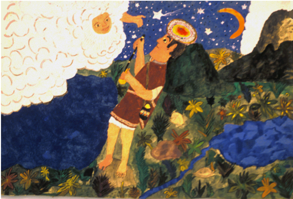
Con Køllimisak en la noche estrellada

Cuando va a llover, el arco se marca de abajo hacia arriba, con los pies hacia arriba; si va a caer páramo, se marca hacia abajo. Así, con el ciclo del año, el arco se redondea, se convierte en arcoris porque es el mismo sol.