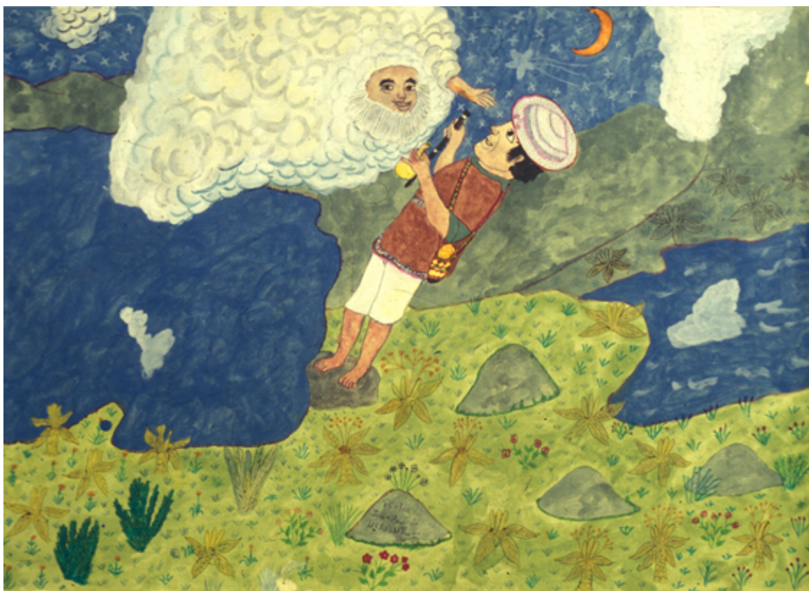
Con Kellimisak en la noche