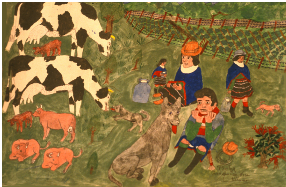
El ordeño de las vacas

En las tierras bajas en donde se desarrolla la vida cotidiana de los guambianos, sobresalen el ganado vacuno y el caballar; del primero utilizan especialmente la leche; los caballos son medio de transporte y de carga. Las recuperaciones de tierras han dado a los guambianos más espacio para tener los animales, que en la época anterior se “emangaban” en los pequeños espacios con pasto en las orilla de los caminos y de la carretera, en franca competencia con las ovejas.