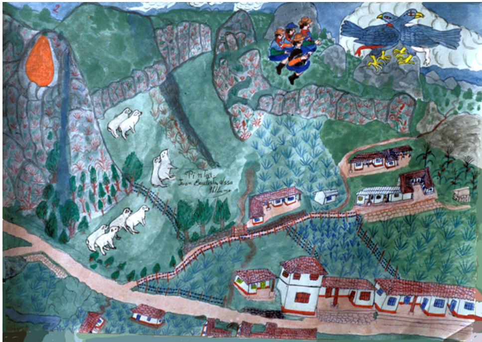
Peñas con cóndores en la vereda Peña del Corazón