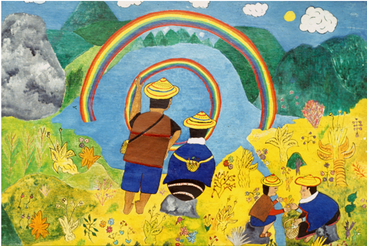
Laguna de Kesrempote , aroiris