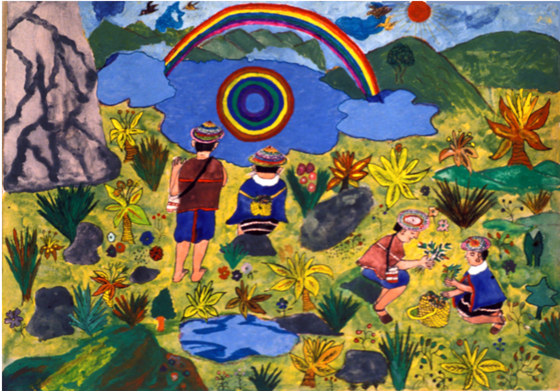
Recogiendo plantas en laguna de aroiris