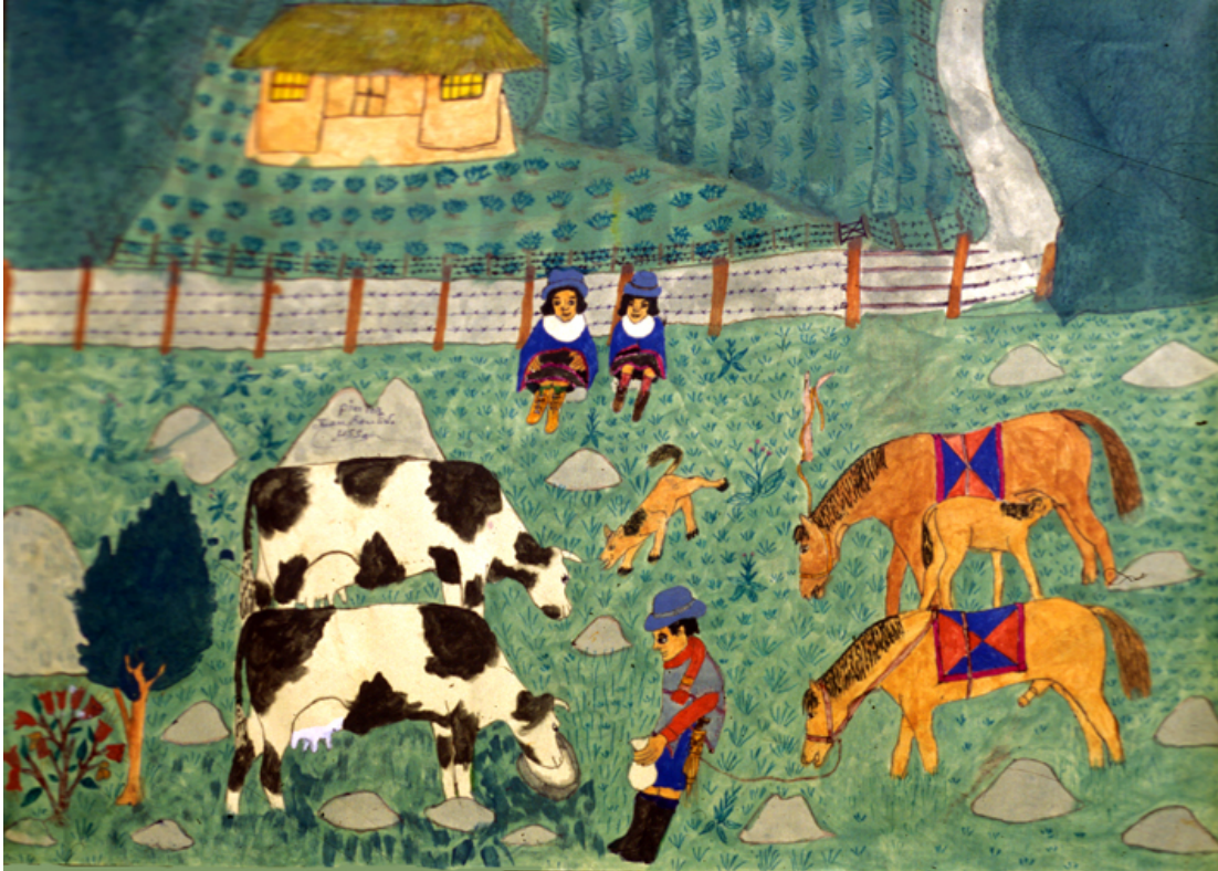
El cuidado de vacas y caballos