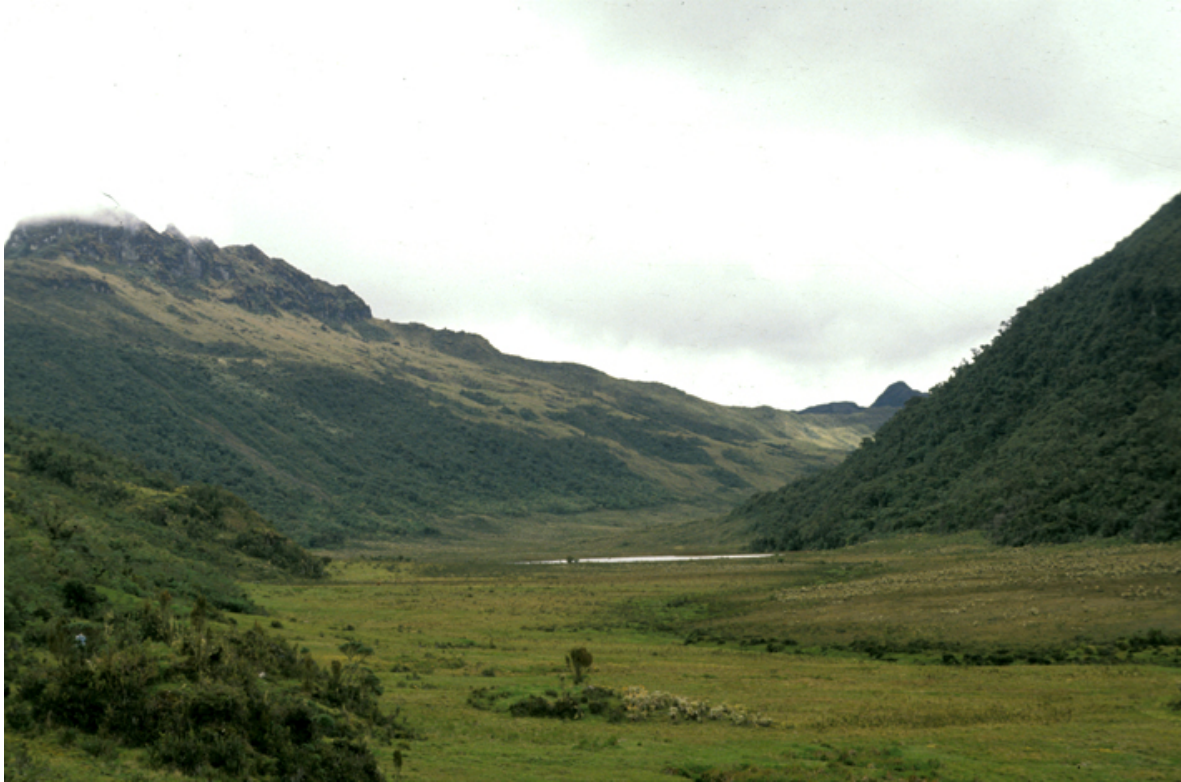
Laguna Ñimpi , en medio de la planada

Años después, como el taita mismo lo explica, Pishimisak le dio indicaciones para que hiciera las pinturas, dándole señas por medio de la piedra del rayo.