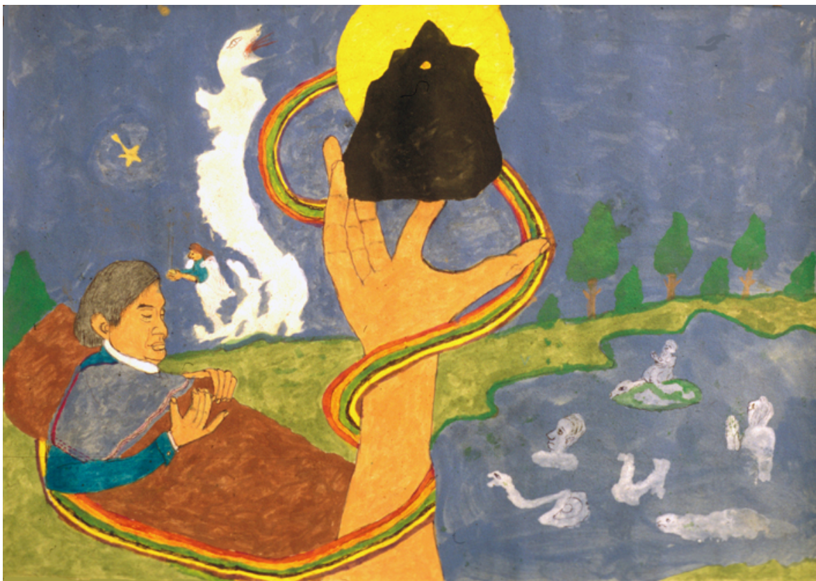
El taita con el sueño y las señas de encontrar piedra del rayo

Llegó a la laguna en la noche e hizo el trabajo. Ofreció cuatro de refresco a la laguna y cuatro de aguardiente. Así a cada una. De cada una salía un rayo que le venía a la cabeza. Cuando ya trabajó las siete lagunas, pudo coger la piedra y llevarla en un saco de lienzo con remedios. Cuando empezó a salir, le pesaba cada vez más; por laguna de Piendamó ya pesaba como tres arrobas. Cuando salió a los potreros, ya pudo salir bien porque por allí pasa mucha gente.