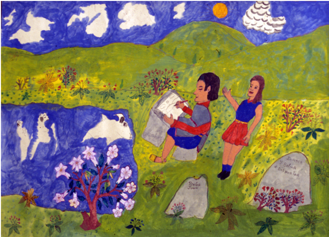
Pishimisak, yash (blanco) y laguna dan señas al pintor

Pishimisak es el dueño de todo y ha dado sus comidas a los guambianos para que puedan vivir. Pero él conserva sus propios alimentos vegetales, en la siguiente pintura se encuentra con ellos en la sabana del páramo.