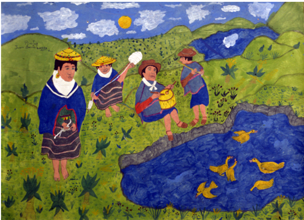
Con la música y el tejido en la laguna