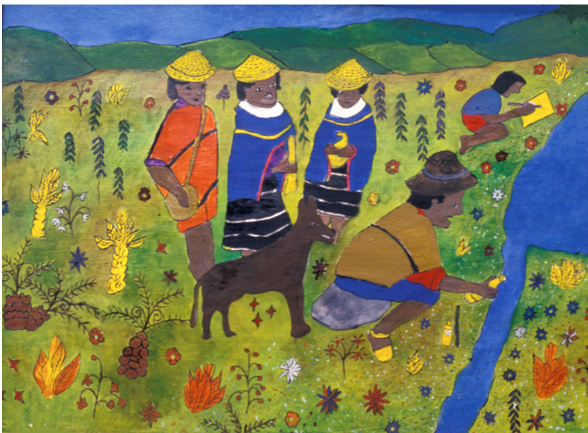
Haciendo refresco en la laguna

De esta obra existe otra versión hecha con la nueva técnica.