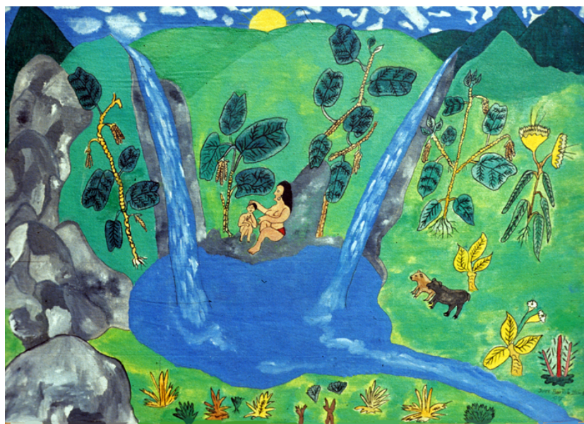
En la laguna de las chorreras

Una última pintura nos deja ver a dos personas no identificadas, una mujer con un niño, sentadas en una piedra a la orilla de una laguna formada por dos chorreras en un sitio no precisado. La presencia de dos animales que parecen ser osos indicaría que hace referencia a los tiempos más antiguos.