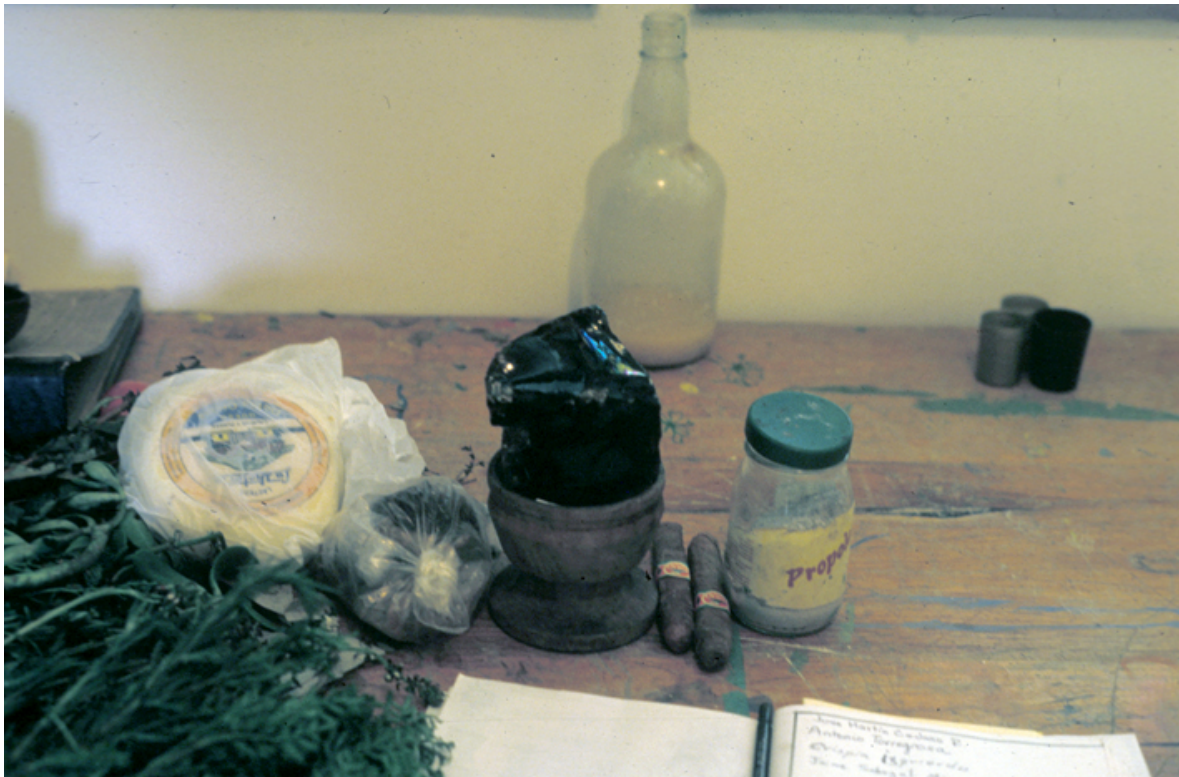
Piedra del rayo y plantas de lo propio

Son dos clases de piedra: la de lo alto, de páramo, Kesrekellimisak , que es más fría y, si se amarra con remedios a la laguna, se calma el viento; la de abajo es más brillante y es de aguacero, Srekellimisak . Pero la de arriba es más fuerte porque es del viento de páramo y es la de los siete metales.