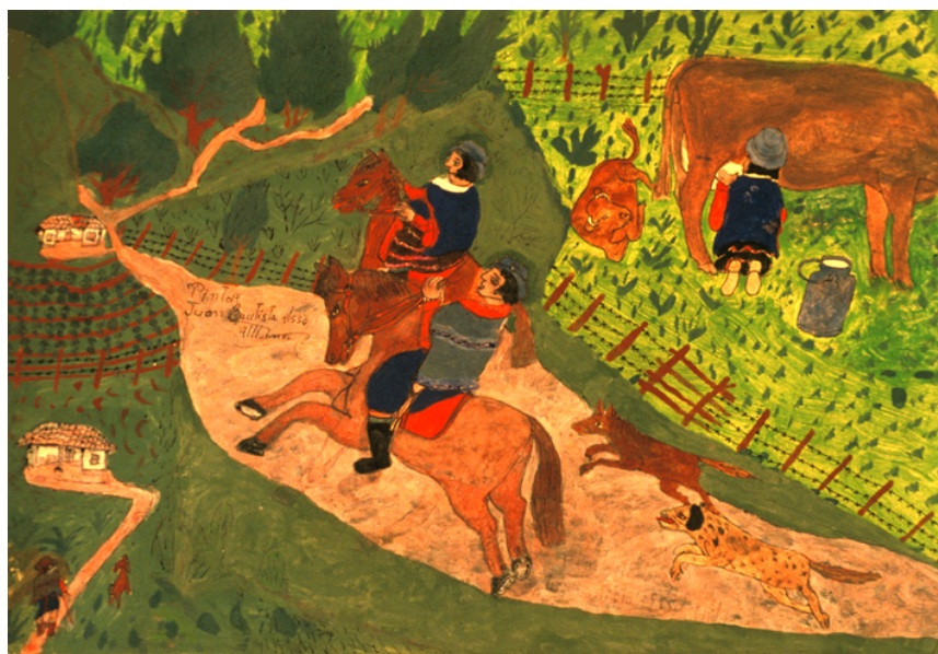
Una pareja a caballo por el camino mientras una mujer ordeña una vaca