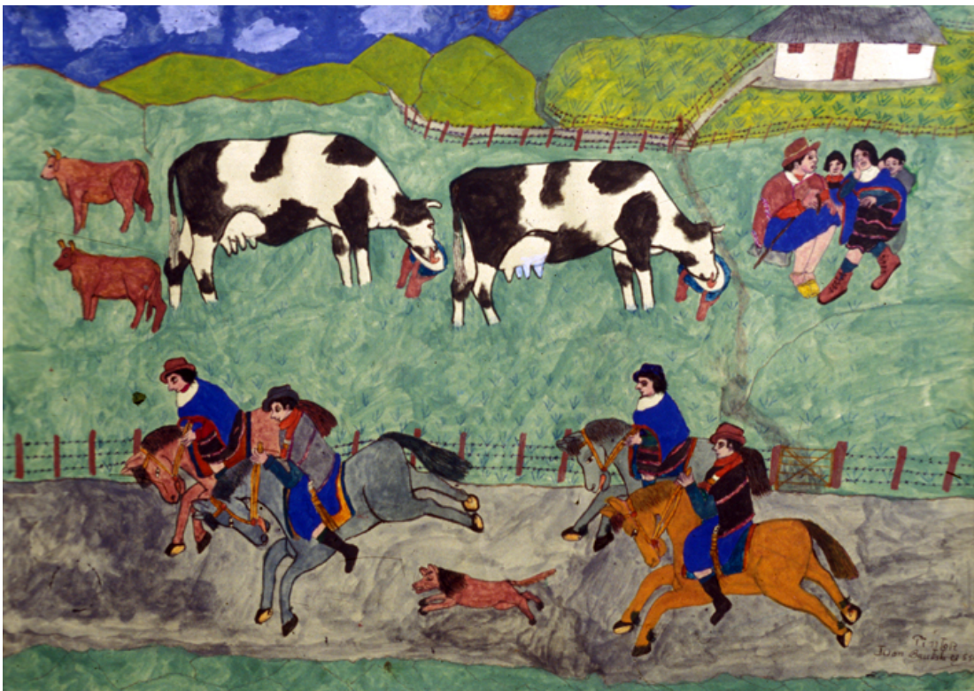
Dos parejas van a caballo con su perro, mientras una familia da sal al ganado