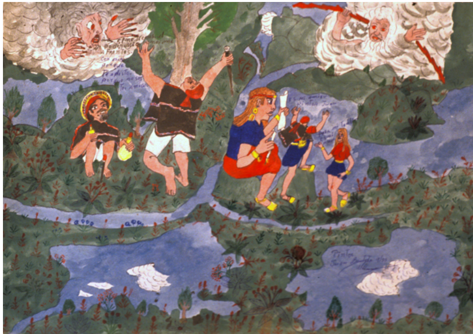
Kəsrekøllimisak , páramo, no es mi amigo, a veces me rechaza