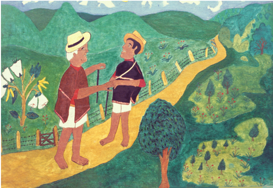
Dos mayores se encuentran por el camino. Nótese el yash al lado izquierdo