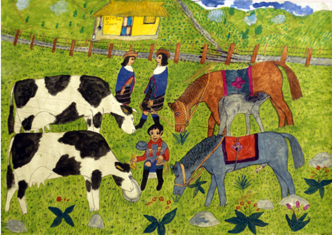
El cuidado de vacas y caballos (otra versión)