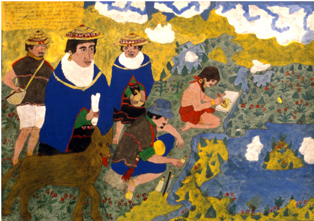
Trabajo de refresco en la laguna

Para mantener renovada su “capacidad” para pintar, es decir, para que la indicación de pintar dada por Pishimisak se mantenga y su inspiración dure, es necesario hacer trabajos periódicos de ofrecer refresco en la laguna.