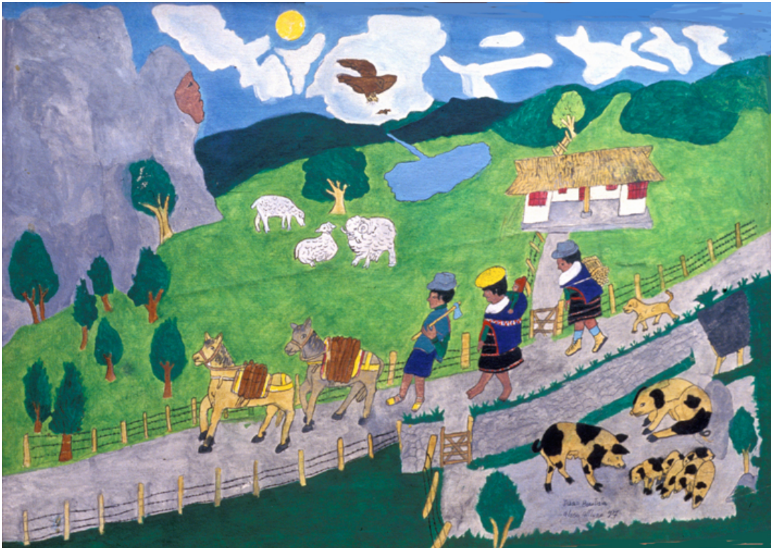
A pie hacia el trabajo. Caballos de carga, ovejas y cerdos