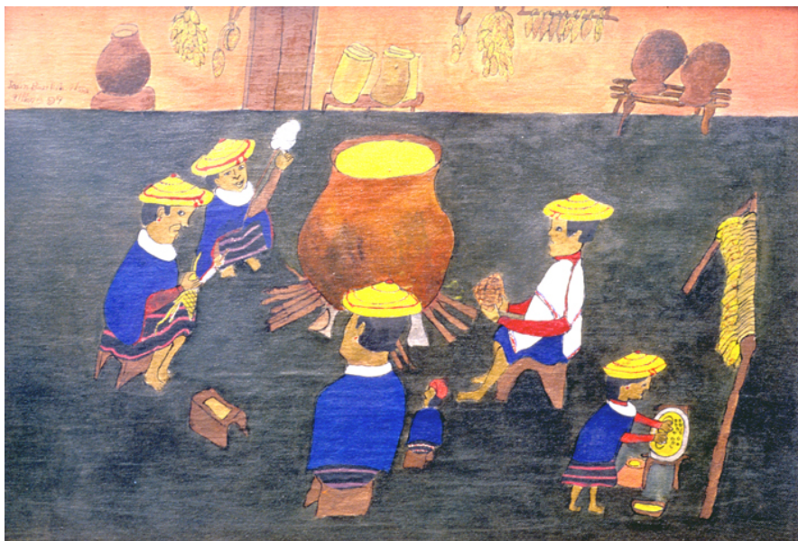
Familia en la cocina alrededor del fogón

La reunión de la familia en la cocina, alrededor del fuego, es de importancia capital en la vida de la sociedad, hasta el punto de que se suele decir que “el derecho nace de las cocinas”. También allí se organizan cada noche los distintos trabajos del día siguiente y se hablan y discuten los problemas del conjunto de la sociedad, cuyas posiciones se van a llevar luego a las asambleas y otras reuniones.