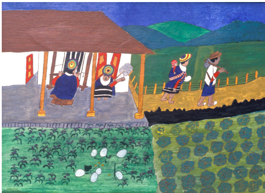
Pareja va al trabajo mientras las mujeres se quedan tejiendo

Algunos de los trabajos cotidianos ocupan también su lugar en la obra del taita Juan Bautista. El tejido del telar, para elaborar las ruanas masculinas y los anacos de las mujeres, aparece con frecuencia. Igual es posible ver el proceso de fabricación del sombrero tradicional, trabajo masculino.