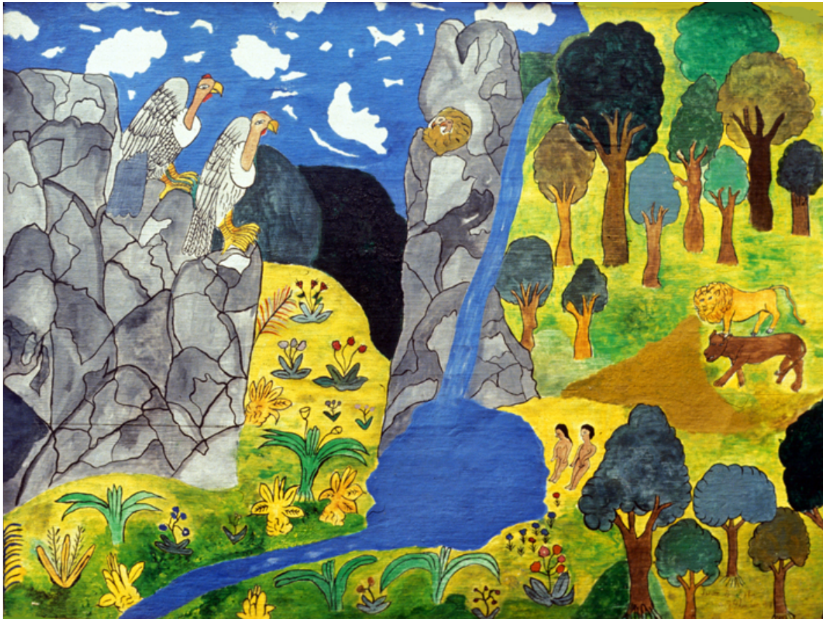
Animales en la chorrera con Pishimisak macho y hembra

Además de los animales, las plantas tienen una presencia importante en las pinturas del taita, no solamente aquellas que rodean a los guambianos en su vida diaria, sino también las de las tierras altas, muchas de las cuales pertenecen a Pishimisak o son curativas. Entre todas, el yash o borrachero destaca por su importancia, porque es una planta que acompaña a los cultivos y los cuida y porque da sueños a las personas, a través de los cuales es posible tener indicaciones sobre lo que se debe o no se debe hacer. El espíritu o sombra del yash en el esmeralda o colibrí, que es el trae los sueños. Hay tres variedades: rojo, blanco y amarillo, cada uno de los cuales tiene un efecto diferente.