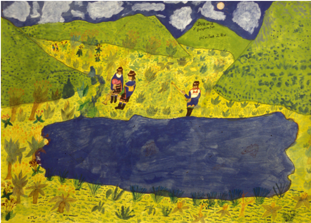
De pesca en la laguna