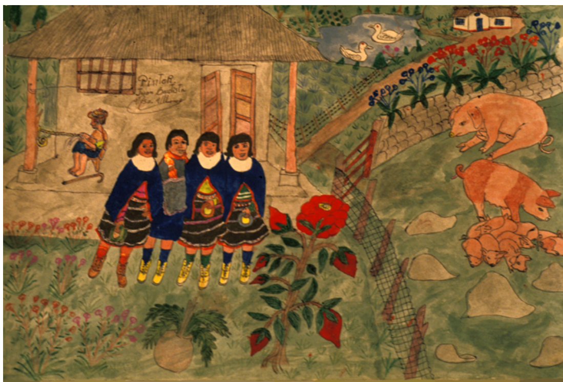
Revisando los cerdos mientras el mayor teje sombrero