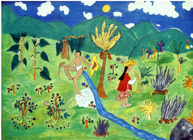
Pishimisak y sus alimentos

Pishimisak aparece aquí en su doble carácter, macho y hembra, pues constituye un par.