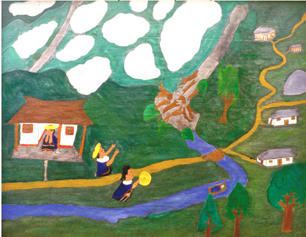
El niño del agua baja por el río