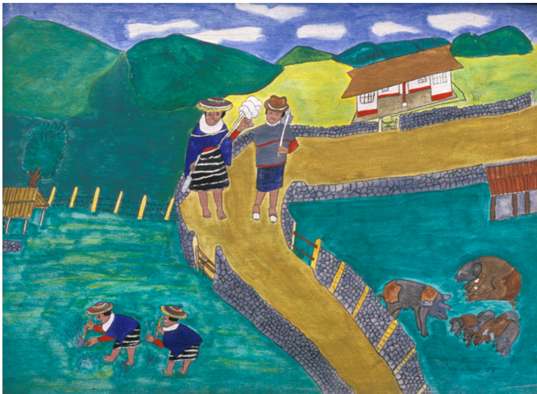
Una pareja pasa por un camino entre cercos de piedra