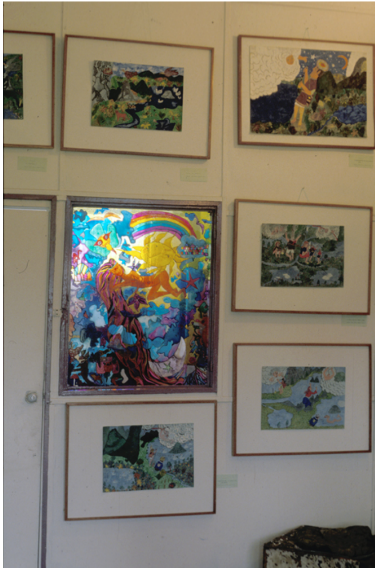
Exposición en la Casita del Telar

Una de esas explicaciones, a la cual tuve la extraordinaria fortuna de asistir, tuvo lugar a la orilla de una pequeña laguna existente en ese lugar. Allí, en una tarde con cielo despejado por completo, sin una nube, el taita se sentó, después de haberse ubicado preguntando en qué dirección quedaba la laguna de Guatavita, con el propósito de “llamar a aguacero”, ante la incredulidad de los asistentes. Allí realizó su trabajo, acompañado de la piedra del rayo, durante mucho tiempo, ya no recuerdo cuánto. Al cabo de una a veces exasperante espera, una diminuta nubecita comenzó a asomarse por encima de los cerros, precisamente en la dirección de la laguna. Y poco a poco fue haciéndose más grande y oscura, acercándose a donde estábamos nosotros, hasta ubicarse precisamente sobre nuestras