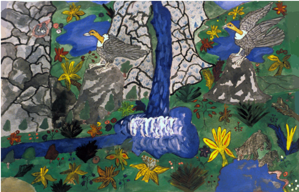
Cóndores y osos en la chorrera de las peñas

Hay una versión de esta pintura con otra técnica y con mucho menos colorido y, sobre todo, con menos detalles.