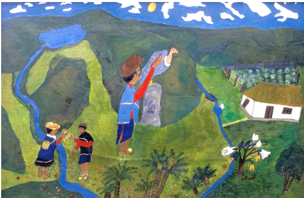
Pintando un cóndor

La antropóloga Sandra León ( El agua y los sueños: Fuentes de recreación estética del pensamiento mítico guambiano , Trabajo de Grado, Departamento de Antropología, Universidad Nacional de Colombia, 1997) cuenta que el taita le relató que, en 1923, el taita encontró la piedra arriba, en el páramo, en el lugar en donde había caído el Srepaley (trueno). En un sueño, un médico nasa que mascaba coca le dijo que no se podía tocar porque su dueño se podía enojar, haciendo enfermar al que la tocara. Por eso, el taita, que era merepik , pidió permiso al rey de las aguas ( Kellimisak ), un anciano con pelos y barba muy largos formados por las propias nubes, dándole refresco para así poder cogerla con el fin de ayudar a otra gente, usándola con su ciencia