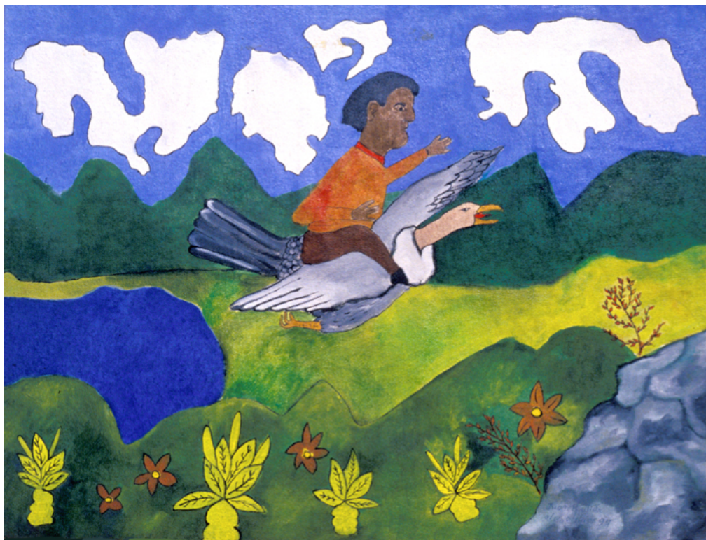
Volando sobre un cóndor en la sabana