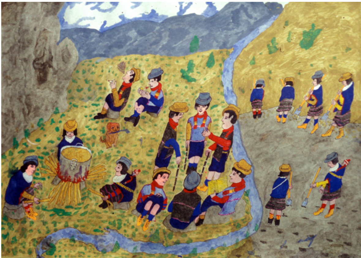
Con el Cabildo en la peña

Sus pinturas muestran también diversos trabajos que tienen lugar en el páramo, en especial en las peña y lagunas. Allí van los cabildos para refrescar las varas de autoridad, los sabios para buscar las plantas curativas, los hombres a pescar, hombres y mujeres para poder realizar bien actividades como el tejido y la música.