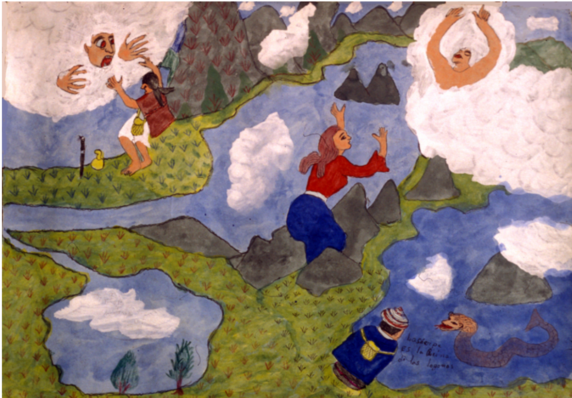
Con páramo, aguacero y sierpi en las lagunas

El mayor Julián Cantero habla: “El páramo es un anciano que vive en las partes altas de las montañas y en las lagunas; allí es su casa. Él lucha contra el aguacero para no dejarlo arrimar a sus territorios. Ambos tienen varas largas y bien puntudas. El páramo sube a una peña bien alta y espera al aguacero y lo golpea con su vara en la mano y en el codo; este responde y lo golpea con la suya en las piernas o en las rodillas. El páramo al fin se cansa y se duerme y el aguacero lo vence y se sube en la peña”.