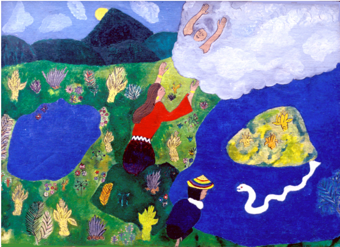
Sierpi en laguna de Piendamú