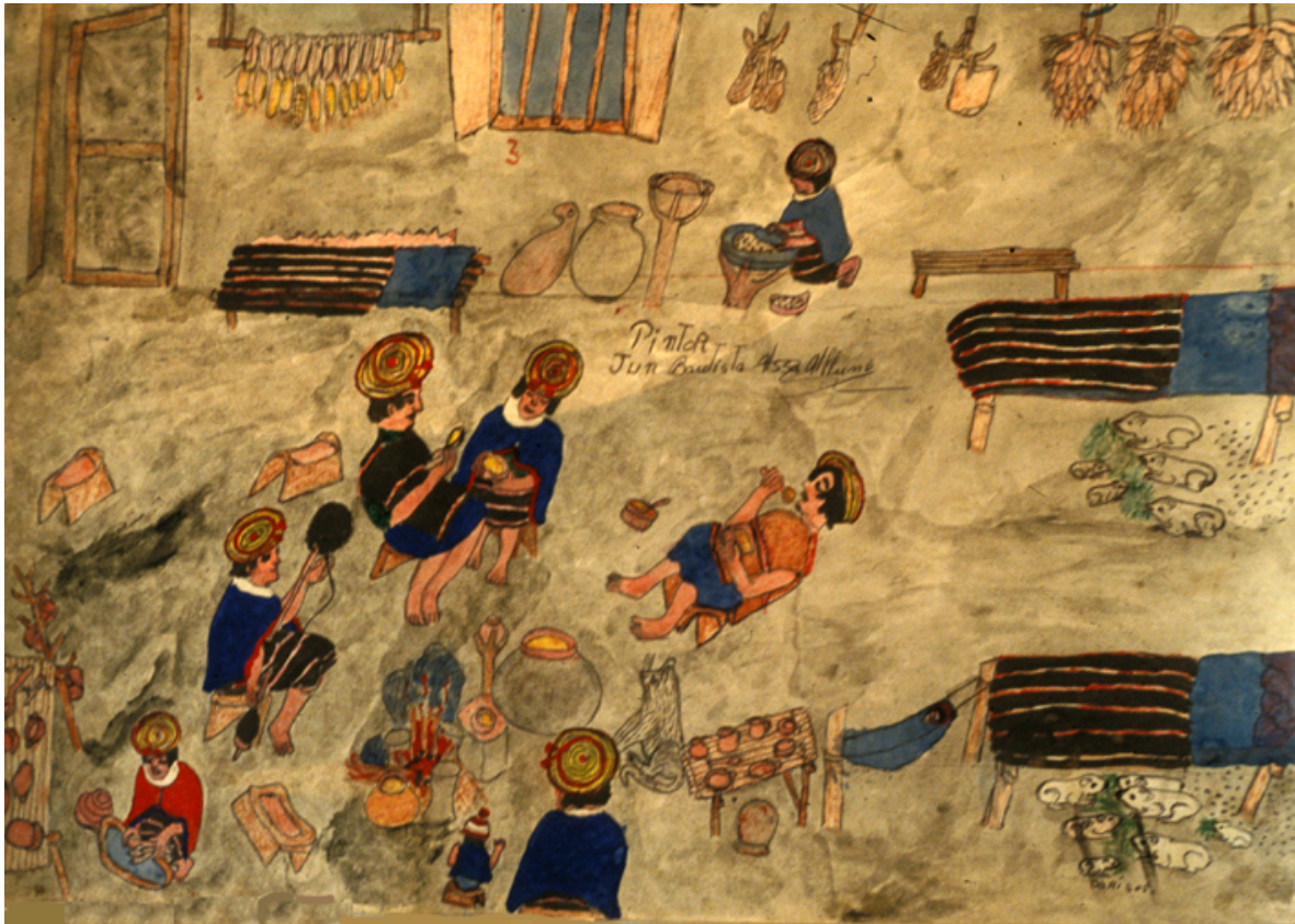
En el nakchak tradicional

Esta última imagen deja ver la estructura tradicional, en la cual la cocina era, al mismo tiempo, dormitorio, aprovechando el fuego para combatir el frío, depósito para guardar el maíz sin desgranar y, de paso, conseguir que el calor y el humo lo mantengan libre de gorgojos y otros depredadores, vivienda de los cuyes, fuente de carne para la alimentación, comedor en donde se consumen los alimentos y lugar de realización de algunos trabajos, como el hilado de la lana o el torcido del merino.