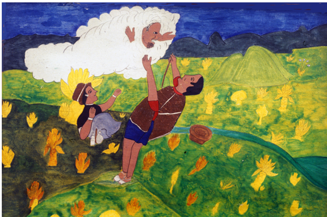
Discutiendo con páramo

De esta pintura hay otra versión, muy simplificada, en la que aparece solamente páramo, Kesrekellimisak , y ya no están presentes sus rayos.