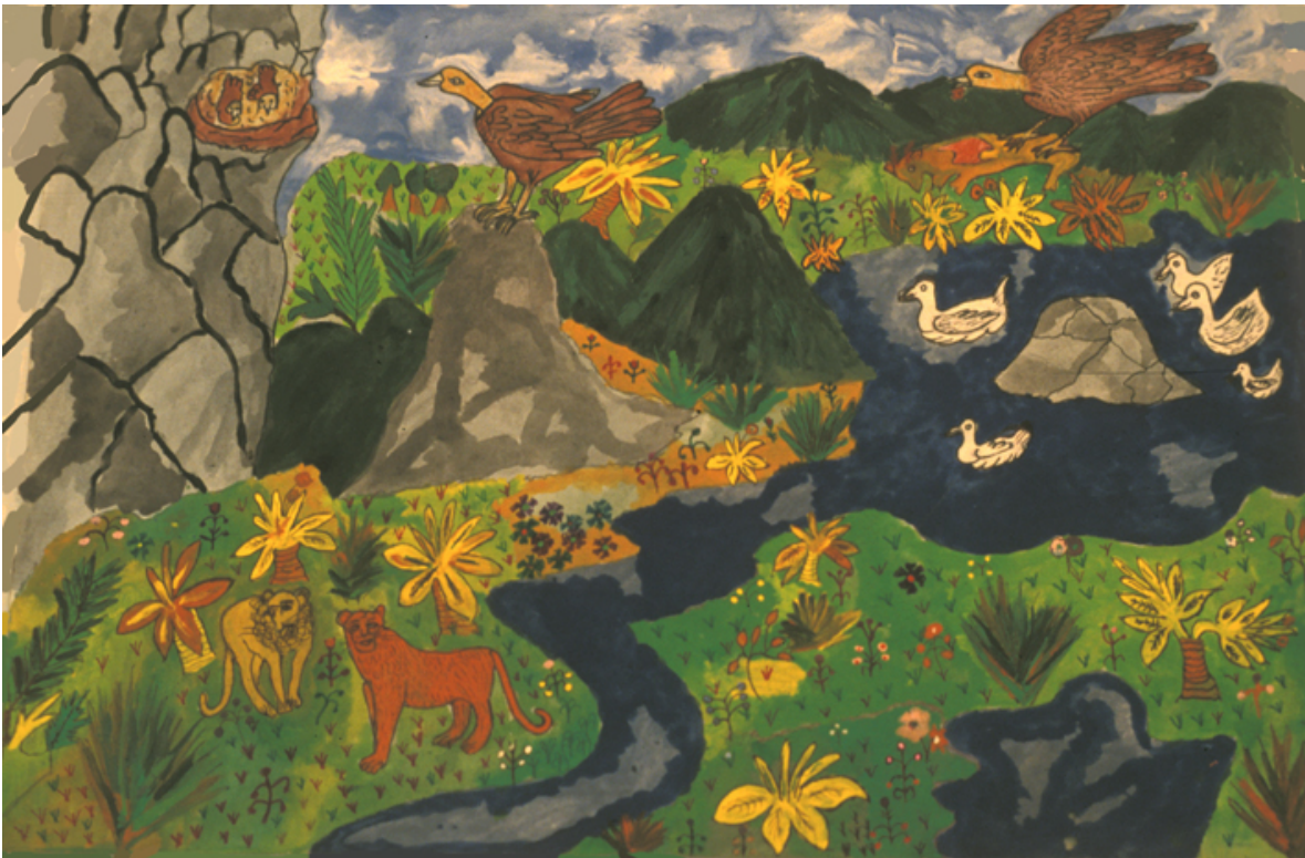
Los animales de la sabana alta

Los animales del páramo están vinculados con aquellos que existían con anterioridad a la llegada de los guambianos a las tierras altas y filos de las montañas: leones, osos, cóndores, y los patos de las lagunas.