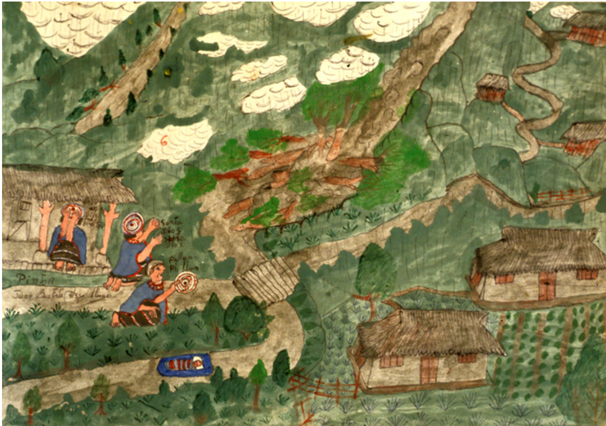
La venida del pino con la palizada por el río