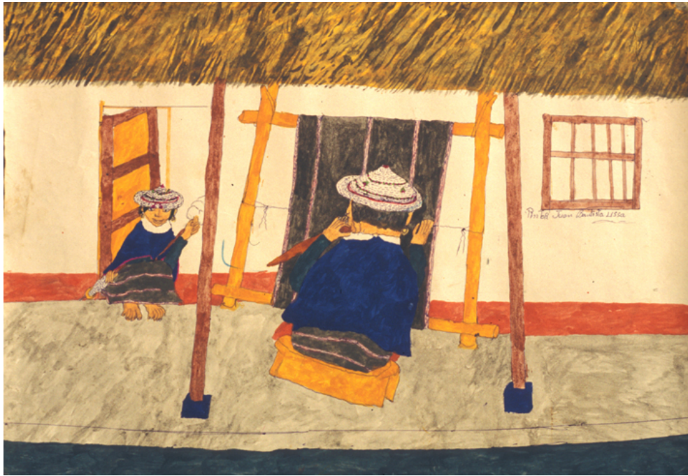
Tejiendo anaco en el telar vertical

La reunión de la familia en la cocina, alrededor del fuego, es de importancia capital en la vida de la sociedad, hasta el punto de que se suele decir que “el derecho nace de las cocinas”. También allí se organizan cada noche los distintos trabajos del día siguiente y se hablan y discuten los problemas del conjunto de la sociedad, cuyas posiciones se van a llevar luego a las asambleas y otras reuniones.